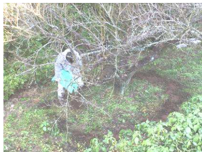
鶏糞まき(今年はいっぱい実をつけてねー)

今年の「七折梅祭り」ではマグネット販売をさせていただきます。ななおれ梅組合さま、ありがとうございます。(2/20-3/10)