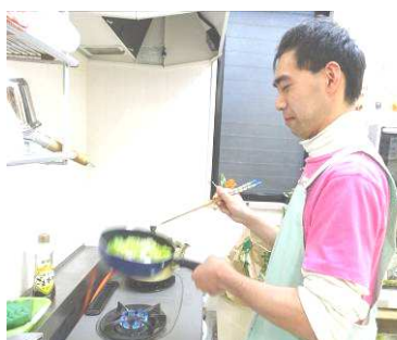
時には職員と一緒に楽しく 食事を作ります。