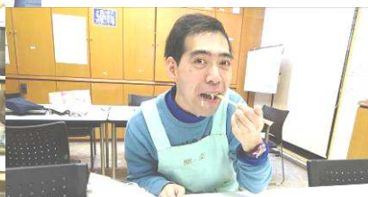
“かんせーい! いっただきまーすっ”