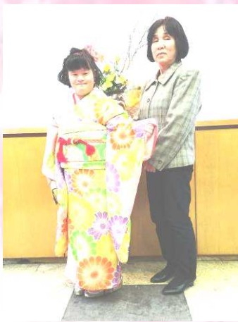
お母様との2ショット(かわいいよ~)

美さんは、皆をあっと驚かせました。人生の幸せな門出にご一緒できてスピーチの時はつい感動して泣いてしまう私でした。これからも、元気で楽しい人生でありますように。