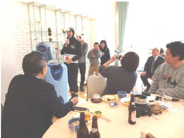
完全に变身しています、、、なりきってまーす