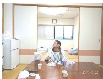
“ゆったり過ごせていいなあ～”